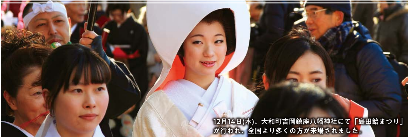
12月14日(木)、大和町吉岡鎮座八幡神社にて「島田鮎まつり」が行われ、全国より多くの方が来場されました。

発行所 黒川郡大和町吉岡南二丁目4-10 くろかわ商工会 発行者 大川 明雄 URL http://www.kurokawa.miyagi-fsci.or.jp/