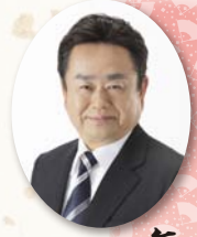
富谷市長 若生 裕俊