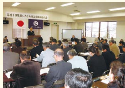
平成19年11月 臨時総代会