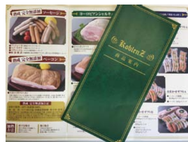
事業で作成したパンフレット

看板設置により、一般顧客の来店機会を創出する事と、電話問合せの増加が図れました。 リーフレット作成は新規ギフト受注増加と、卸先来店客