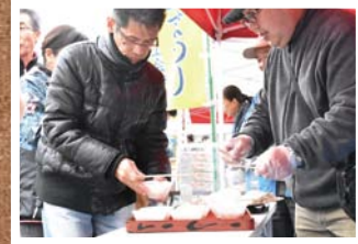
11月 第21回大和商工まつり