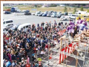
11月 おおさと秋まつり