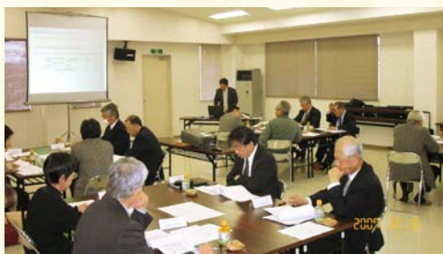
平成19年12月 地域問題に関する懇談会