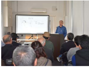
熱心に阿部氏のまちづくり講話に聴き入る参加者達

秋晴れが広がる十月二十六日（木）、本会商業・工業・サービス業部会の会員を対象とした三部会合同視察研修を実施しました。会員間の交流の促進と地域商工業の振興発展に寄与することを目的に、毎年開催しており、今年は、南三陸方面へ行き、東日本大震災から六年経った復興の様子を視察しました。