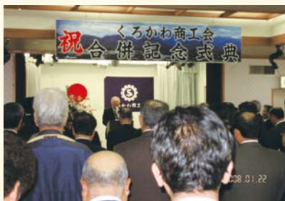
平成20年1月 合併記念式典