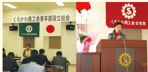
平成19年11月 青年部・女性部設立総会