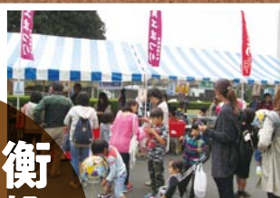
10月 おおひらふるさと祭り