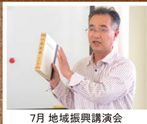
7月 地域振興講演会