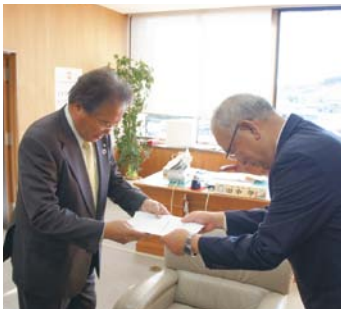
要望書を提出する大川会長