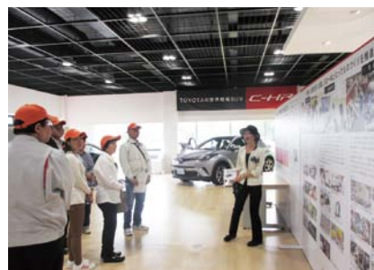
熱心に説明を受ける参加者たち

導入され、人に優しく効率的な生産ラインが組まれているなど、作業者の負荷軽減を考慮した仕組みになっている等の説明を受け、参加者たちは熱心に各製造工程を見学していました。