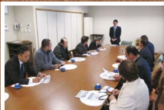
11月 大衡支部視察研修 (左:福島県国見町道の駅あつしの郷 右:山元町いちご農園にて)