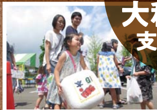
8月 第20回大和商工まつり