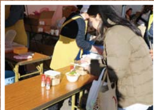
11月 富谷市ふるさとまつり