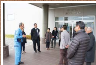
11月 大郷支部視察研修 (仙台火力発電所・太陽光発電所・キリンビール仙台工場)