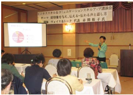
赤間先生のお話を熱心に聞く様子