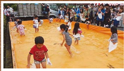
8月 おもしえがらきてけさin富谷