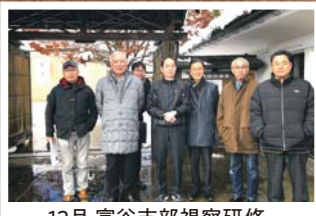
12月 富谷支部視察研修 (福島県喜多方~会津若松方面)