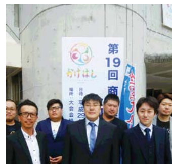
全国大会会場前での集合写真