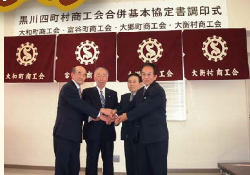
平成19年3月 合併基本協定書調印式