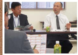
9月 まちづくり懇談会